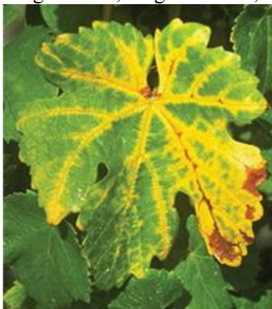
Levél sárgulás

Augusztus és szeptember hónapokban a főerek mentén krémsárga foltok jelennek meg, amelyek fokozatosan terjednek a levélfelületen, végül a teljes levél elszárad. Az így elhalt, megkeményedett levelek ősszel később hullanak le, mint az egészségesek. Télen a be nem érett vesszők elfeketednek és elpusztulnak. A következő tavasszal a megmaradt rügyekből keletkező virágzat leszárad, kevesebb fürt képződik. Késői fertőzés esetén a bogyók zsugorodnak, megbarnulnak, rossz ízűvé válnak.