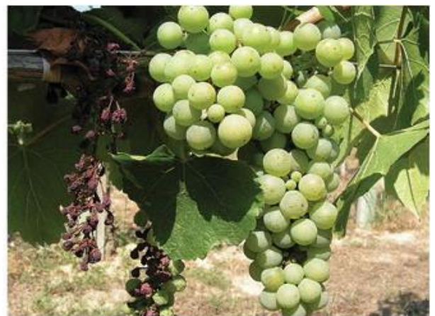
Megbarnult bogyók